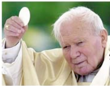
Påven håller den romerskkatolske Jesus Den eukaristiske Jesus offrad som ett oblodigt offer

Romersk katolicism förklarar att vår frälsning inte var fullständig genom Jesu död på korset. Frälsning på det romerskkatolska viset kräver att eukaristins sakrament delas ut av romerskkatolska präster. Om detta är fallet dog Jesus på korset i onödan. Frälsning är inte romersk katolicism plus Jesus. Biblisk frälsning grundas enbart på tro på Jesus!